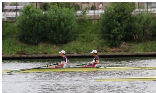
男子舵手なしペア