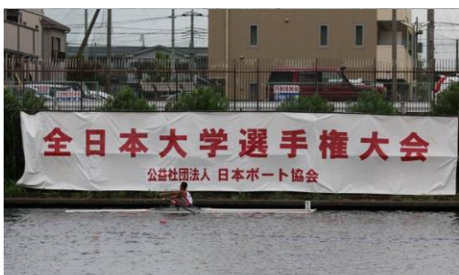
男子シングルスカル