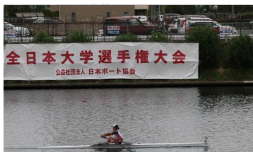
女子シングルスカル