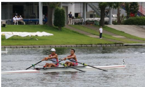
男子ダブルスカル